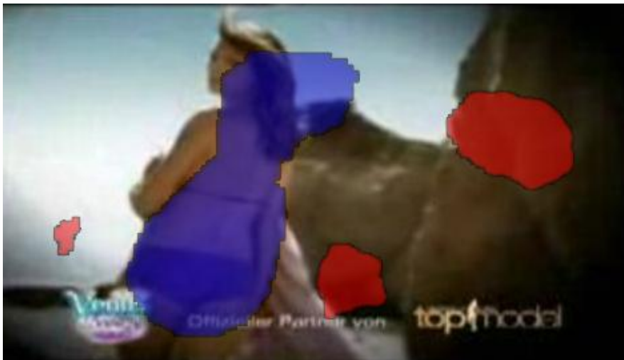
Abbildung 1: Gillet – Venus: Blauer Bereich: Besonders von Männern beachtet. Roter Bereich: Besonders von Frauen beachtet. Gut zu sehen ist, dass Frauen „ins Nichts“ schauen – also tatsächlich der jungen Frau visuell ausweichen.

Die positive Emotionalisierung muss also keineswegs Hand in Hand gehen mit der gewünschten Lenkung der Aufmerksamkeit und der Wahrnehmung durch das Key-Visual. Ein sehr spannendes Beispiel, wie komplex und wenig vorhersagbar sich effektive Werbewirkung im Alltag darstellen kann.